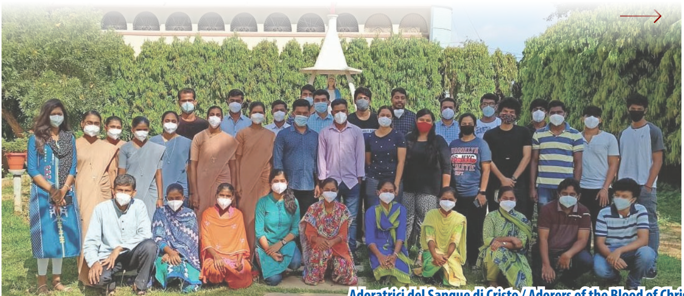
Adoratrici del Sangue di Cristo / Adorers of the Blood of Christ

Većina ih je izgubila svaku nadu, jedino što su željeli bilo je pažljivo uho i suosjećajno srce koje je razumjelo cijelu traumu kroz koju su prolazili: neki su pacijenti izgubili voljene osobe, članovi obitelji nekih pacijenata primljeni su u drugu bolnicu, neki nisu vidjeli svoje najmilije dulje od mjesec dana, neki su ostali bez posla, a neki od njih bili su zabrinuti zbog ogromnih bolničkih računa koje će morati platiti kada budu otpušteni. Te su ih stvari jako brinule. U ovoj bolnoj stvarnosti obišli smo svakog pacijenta i proveli kvalitetno vrijeme sa svakim od njih slušajući njihove priče, tješeci ih, dajući im hrabrost i pozitivnu energiju kroz naše riječi ljubavi i terapijski dodir i govoreći im da će uskoro biti u mogućnosti izvući se iz ove nevolje i da će se vratiti svom normalnom životu. Sve je ovo na njih djelovalo pozitivno kako bi se suočili s bolju i s više nade i osmijeha na licima. Mnogi su nam pacijenti izrazili zahvalnost kad su se oporavili i bili otpušteni; ovo vrijeme provedeno u bolnici bilo je vrijeme velikog zadovoljstva za svakoga od nas jer smo unatoč svemu riskirali da u njihov život unesemo malu zraku nade.