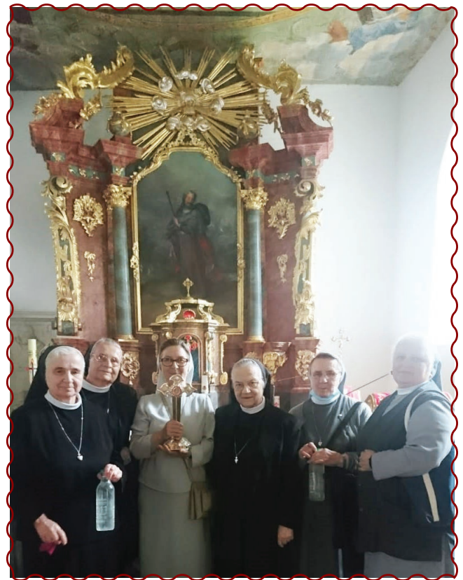
figura de S. Santiago, a la historia de este lugar y a la peregrinación. El motivo cultural es porque todo lo que nos cuenta se puede ver a ojo desnudo o tocar directamente con mano.

Después de la eucaristía, el custodio invitó a los peregrinos al AGAPE fraterno al estilo de la vieja hospitalidad polaca. ¿Por qué vale la pena ir a Jakubow? Los motivos para visitar el santuario son dos: espiritual y cultural. La experiencia espiritual de la visita a Jakubow está unida a la