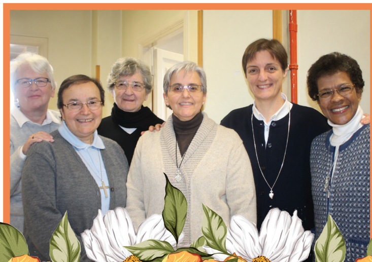
ROME CONSTELLATION MEETING