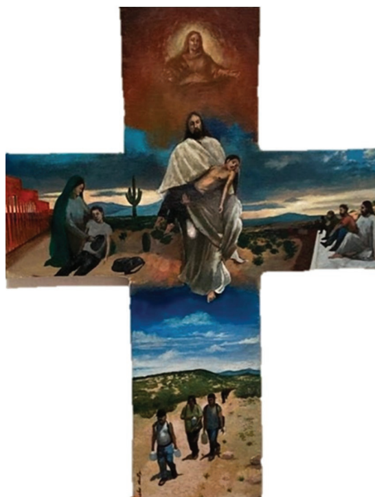
La cruz de los inmigrantes, del artista local Wences Kino Iniciativa de frontera Nogales, Sonora