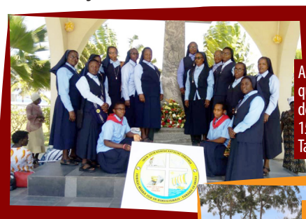
As Irmãs ASC e duas noviças que participam de dois dias de preparação e celebração de 150 anos de evangelização na Tanzânia continental