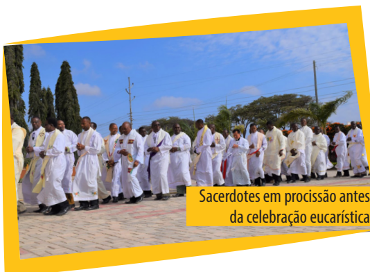
Sacerdotes em procissão antes da celebração eucarística