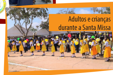
Adultos e crianças durante a Santa Missa