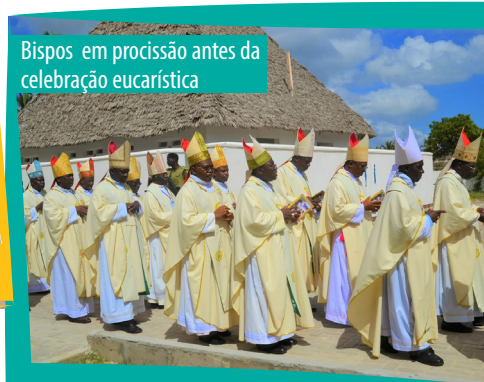
Bispos em procissão antes da celebração eucarística