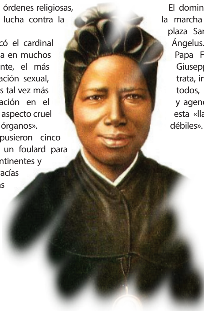
Santa Giuseppina Bakhita