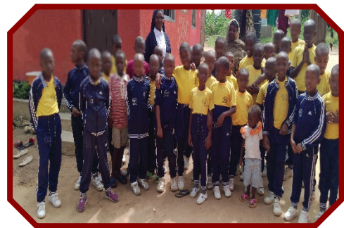
s. Everegisla Costantine Mrosso, ASC

Kasnije su posjetili i dvoje starijih osoba koje žive u blizini škole i njima su odnijeli korisne osobne stvari kojih su se oni odrekli. Ove starije osobe su bile duboko dirnute velikodušnošću ove djece i njihovoj mogućnosti žrtvovanja svojih malih stvari u korist drugih. Zahvalili su im i ohrabрили ih da nastave činiti dobro drugim osobama, blagoslivljajući njihov studij. Priznanje starijih osnažilo je kod djece želju za činiti dobro, potičući ih da nastave volontirati za druge u potrebi. Pomolimo se svetoj Mariji De Mattias da se u svima poveća gorljivost da i dalje ljube Boga i bližnjega.