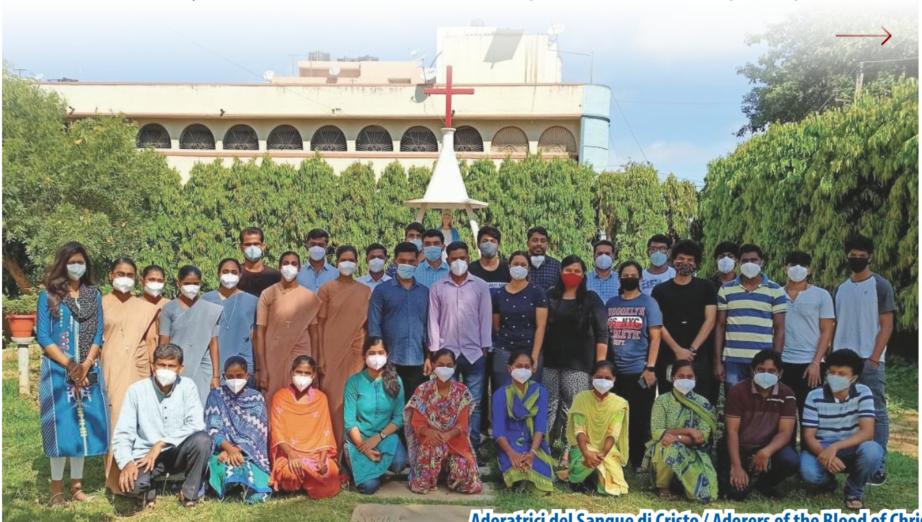
Adoratrici del Sangue di Cristo / Adorers of the Blood of Christ

Wengi wao walikuwa wamepoteza tumaini lote, walichokuwa wanataka ni sikio la uangalifu na moyo wa huruma ambao ulielewa shida zote walizokuwa wakipitia: wagonjwa wengine walikuwa wamepoteza wapendwa wao kwa covid, wanafamilia na wagonjwa wengine walilazwa katika hospitali nyingine. Wengine walikuwa hawajawaona wapendwa wao kwa zaidi ya mwezi mmoja, wengine walikuwa wamepoteza kazi na wengine walikuwa na wasiwasi juu ya bili kubwa za hospitali walilazimika kulipa waliporuhusiwa.