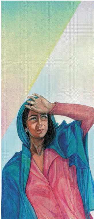
Obra de Carmela Boccasile

y plenarias, pueda dar la posibilidad a un mayor número de hermanas de llevar la contribución efectiva a nuestra vida y misión. En las asambleas plenarias, cada participante tendrá la posibilidad de expresar el propio pensamiento, compartir las propias ideas y ofrecer la propia votación consultiva sobre las orientaciones a tomar.