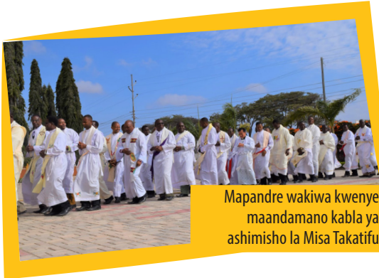
Mapandre wakiwa kwenye maandamano kabla ya ashimisho la Misa Takatifu