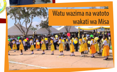
Watu wazima na watoto wakati wa Misa