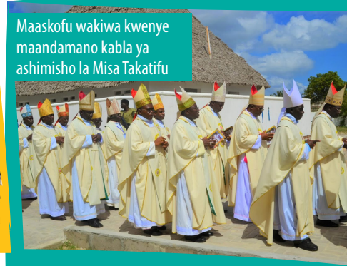
Maaskofu wakiwa kwenye maandamano kabla ya ashimisho la Misa Takatifu