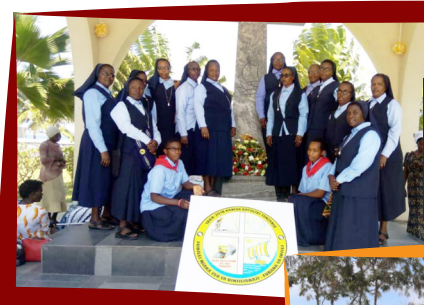
Masista ASC na wanovisi wawili walio Shiriki siku mbili za maandalizi na sikukuu ya miaka 150 ya Uinjilishaji Tanzania Bara