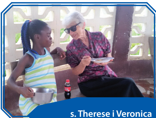
s. Therese i Veronica