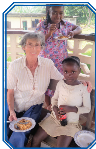
s. Zita s Therese i Veronica