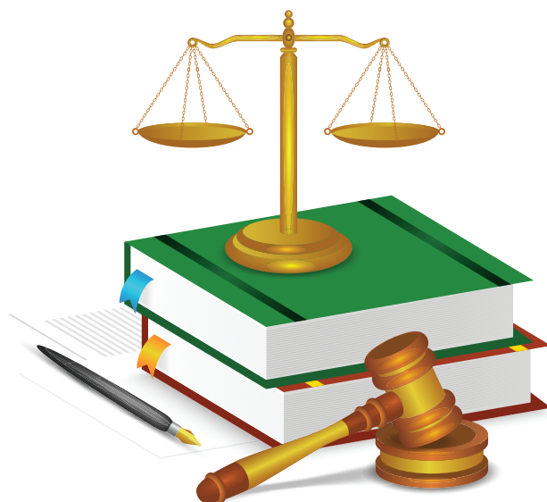
s. Shiny Kayyaniyil, ASC - odvjetnica

Gledajući unazad, zahvaljujem Bogu što mi je dao priliku da učinim nešto drugačije za ljude: da budem glas za one koji nemaju glasa.