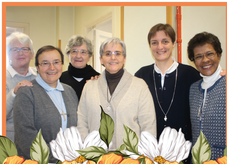
ROME CONSTELLATION MEETING