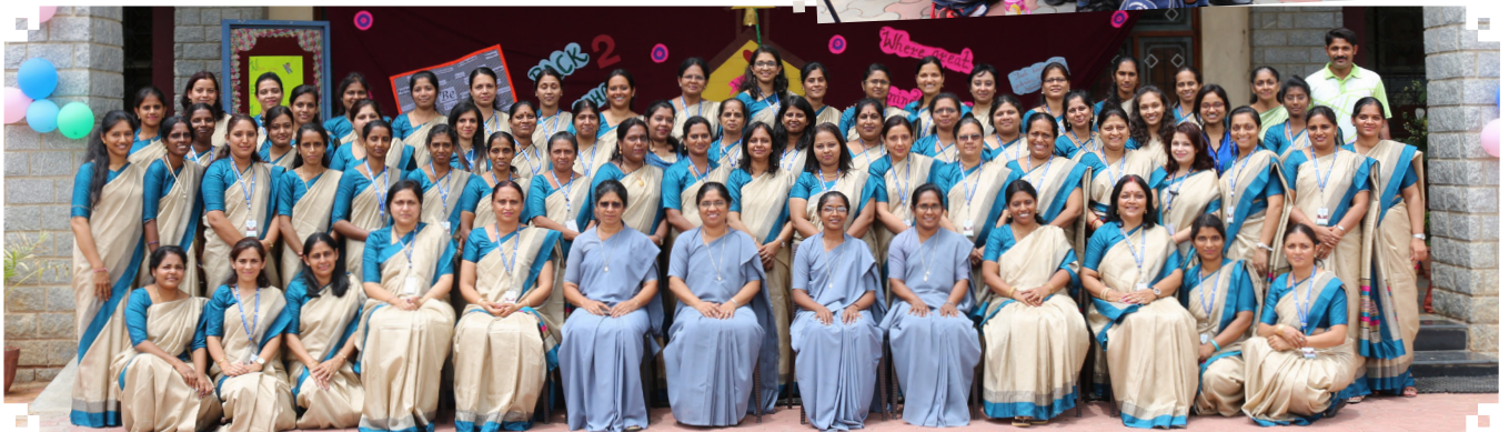
Shule ya Aradhana - India-Bangalore