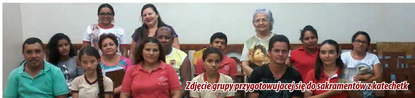
Zdjęcie grupy przygotowującej się do sakramentów z katechetk