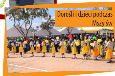
Dorośli i dzieci podczas Mszy św