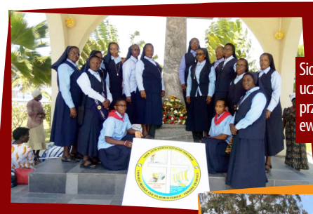
Siostry ASC i dwie nowicjuszkii uczestniczące w dwóch dniach przygotowań i celebracji 150 lat ewangelizacji w Tanzanii