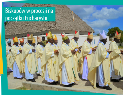
Biskupów w procesji na początku Eucharystii