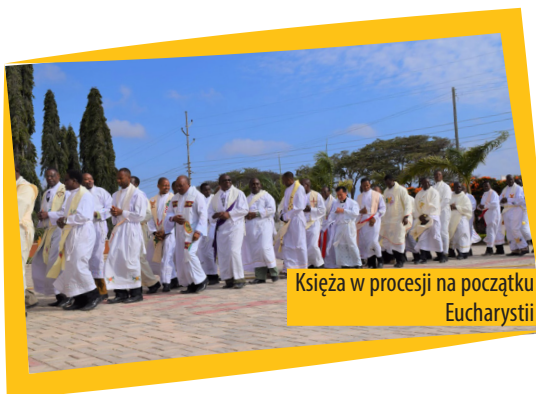
Księża w procesji na początku Eucharystii