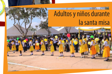
Adultos y niños durante la santa misa