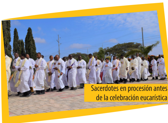
Sacerdotes en procesión antes de la celebración eucarística