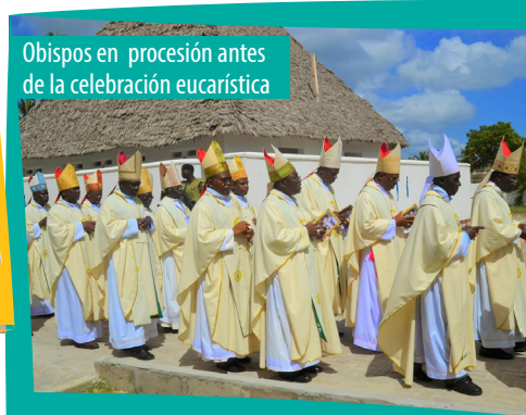
Obispos en procesión antes de la celebración eucarística