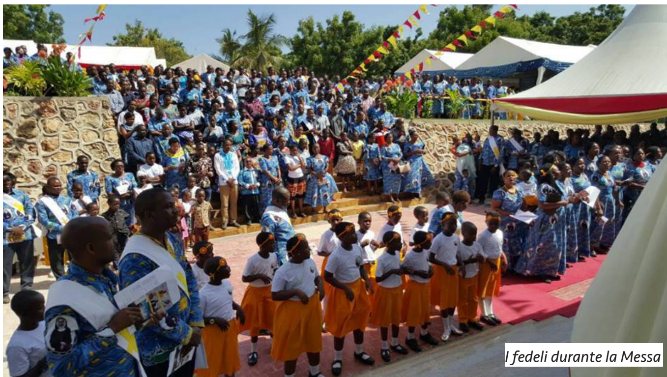
I fedeli durante la Messa