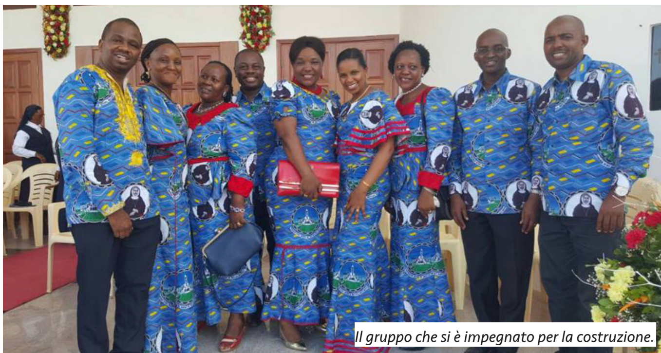
Il gruppo che si è impegnato per la costruzione.

In precedenza questa vice-parrocchia era stata intitolata a S. Monica. Più tardi il titolo è stato cambiato perché il nome di S. Monica era già utilizzato da altre parrocchie e vice-parrocchie della diocesi. Ed è stato il Cardinale Polycarp Pengo, arcivescovo dell'arcidiocesi di Dar es Salaam, a dedicarla ufficialmente il 28 agosto 2013, a Santa Maria De Mattias. La Chiesa è divenuta poi