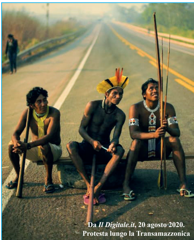
Protesta lungo la Transamazzonica