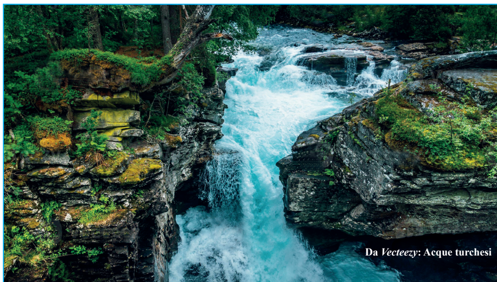
Acque turchesi

La fede di Santa Maria De Mattias era grande. Credeva nella presenza del Signore nella sua vita e che Egli poteva trasformarla; perciò si lasciava portare e nutrire dal desiderio di affidarsi a lui. Il cammino per cui il Signore la conduceva è stato doloroso e difficile, segnato dal limite e dalla tentazione, ma in esso ella già sperimen-